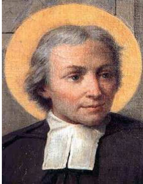
SAINT JEAN-BAPTISTE DE LA SALLE